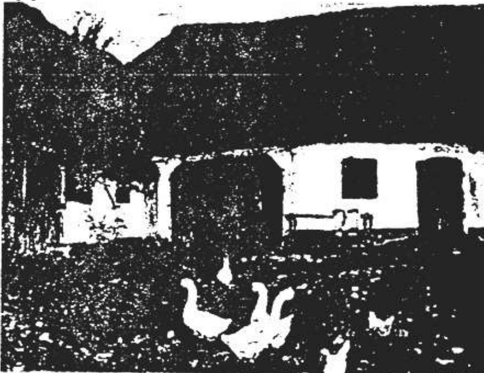
Et hjørne af gårdspladsen (omkr. 1930)