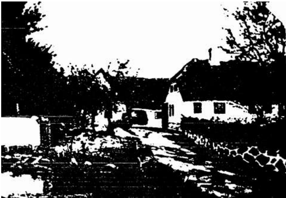
Rønholm ca. 1930