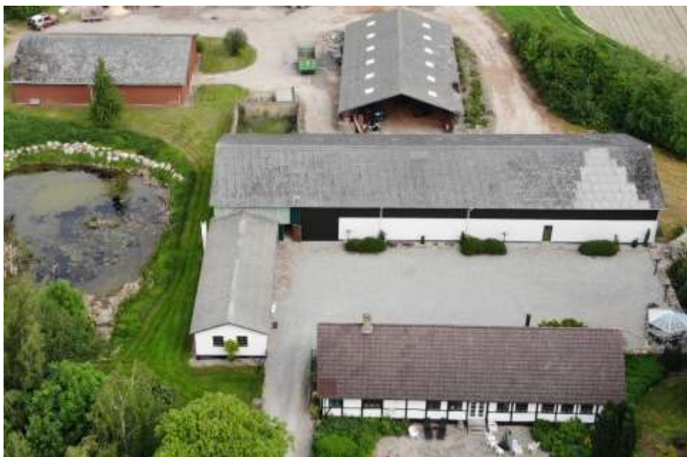
Rønholm i 2019