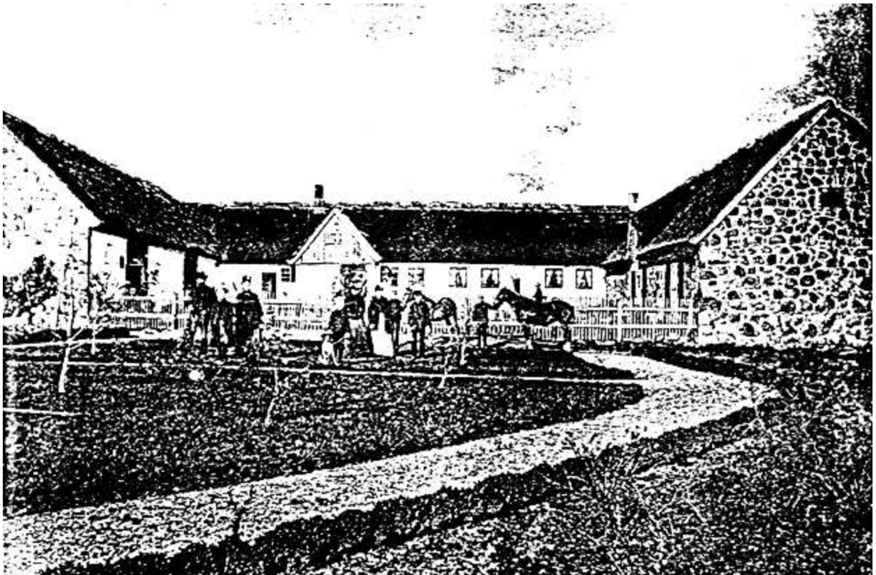
Højgård – ca. år 1900

Gården er opført i 1798 som en trelænget gård med stuelængen som midterste nordlige bygning. På nedenstående foto er stuelængen den oprindelige, mens de to andre længer er opført i forbindelse med ombygning i 1874. I 1912 blev det nye stuehus bygget på det sted, hvor personerne står, og derefter blev det gamle stuehus lavet om til svinehus. Dette svinehus blev revet ned i 1952 og erstattet med det nuværende svinehus.