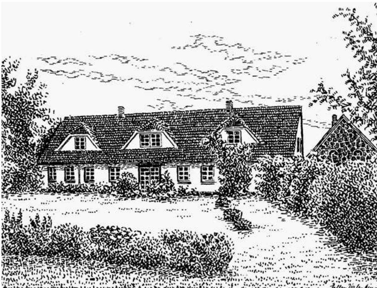
Billede fra 1989 efter at tømrermester Biskopstø har renoveret stuehuset.