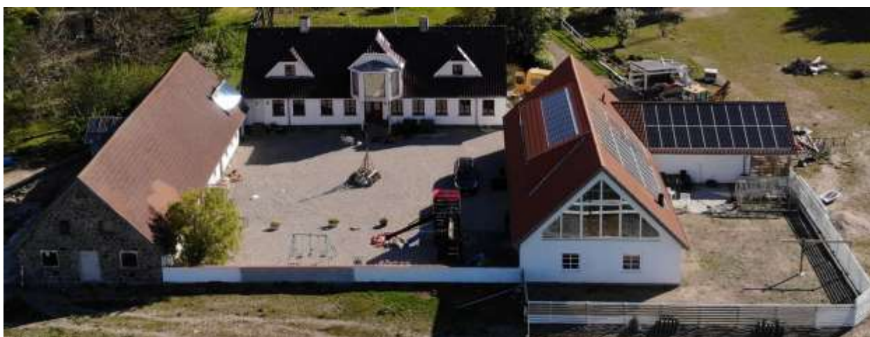
Klintenæs i 2019